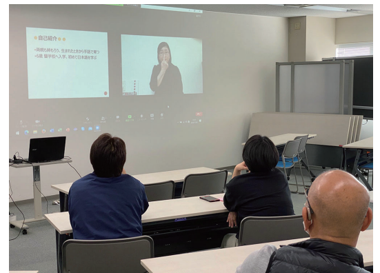
那須氏の映像に見入る参加者

いずれ、新型コロナウイルスが終息し、以前の様に直接本人に会っていただき、講演していただける時まで、最善策を考えつつ事業の計画を進める必要があります。